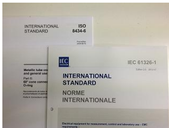
写真 1. 国際規格（例）ISO 規格と IEC 規格

1995 年の WTO/TBT 協定の発効により、各国の国内規格は、基本的に国際規格に整合していることが求められるようになったことから、ISO（国際標準化機構）、IEC（国際電気標準会議）等の国際規格は、技術の発展、貿易の円滑化において極めて重要な意味を持つことになった。また、中国が 2001 年に WTO（世界貿易機関）に加盟したことも、国際規格の重要性を飛躍的に高めている。