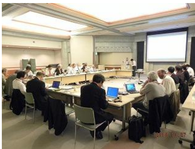
写真 2. TC201 が参加した TC202 沖縄総会 (国際会議・2010年10月27-29日開催)